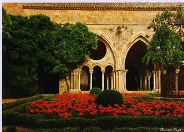
La splendide abbaye de Fontfroide, à Narbonne.

À voir, l'exposition à Paris de la photographe Amarante Puget, sur le thème des "Abbayes viticoles". L'artiste présente ses œuvres au Collège des Bernardins (20, rue de Poissy, 75005) les 19 et 20 avril, lors du Salon des vins d'abbayes. Vernissage le 19 avril de 17 h à 19 h en présence de l'artiste qui dédicacera ses œuvres.